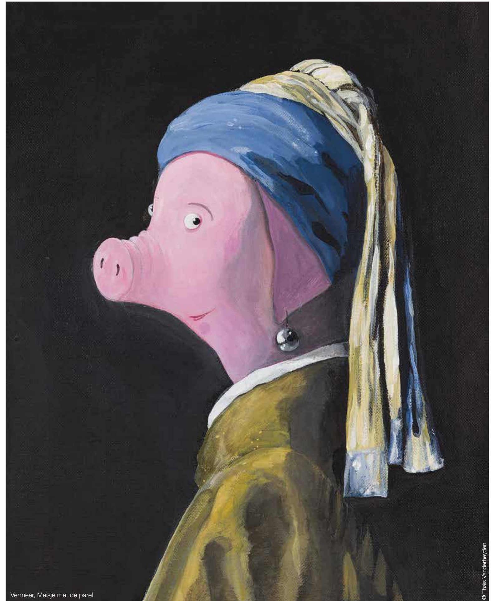
Vermeer, Meisje met de parel

Technisch aangelegd of niet: kinderen vormen zowat het meest genadeloze publiek en niet alle kunstboeken voor kleintjes slaan aan. Integendeel. "Dat is zo jammer, want er bestaan echt prachtige publicaties, maar een neen is een neen bij zo'n jong publiek. Ik wil kunst laagdrempelig maken en ervoor zorgen dat ze zelf een museum binnen durven stappen en de discussie kunnen aangaan over de werken die ze zien. Dat hoeft niet altijd verheven te zijn, soms is een pipi-kaka-mopje de perfecte ijsbreker om het met een zesjarige over het oeuvre van Sandro Botticelli te hebben. Een uitgever zei me ooit dat ik met de verwondering van een kind naar de wereld kijk. Op één of andere manier ben ik ergens blijven steken denk ik, een soort van Peter Pan-syndroom. Ik herken dat bij mijn eigen idolen Astrid Lindgren of Roald Dahl. Je voelt in hun boeken dat ze precies meer voeling hebben met kinderen dan volwassenen. En soms weet ik het zelf ook niet, maar dan moet je een sprong in het diepe durven wagen. Ik heb één Grote