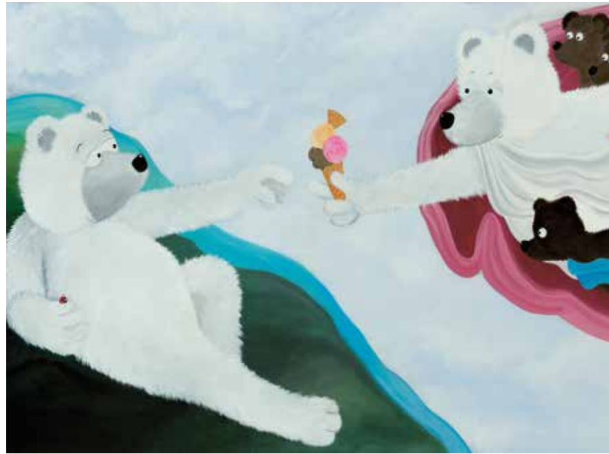
Michelangelo, De schepping