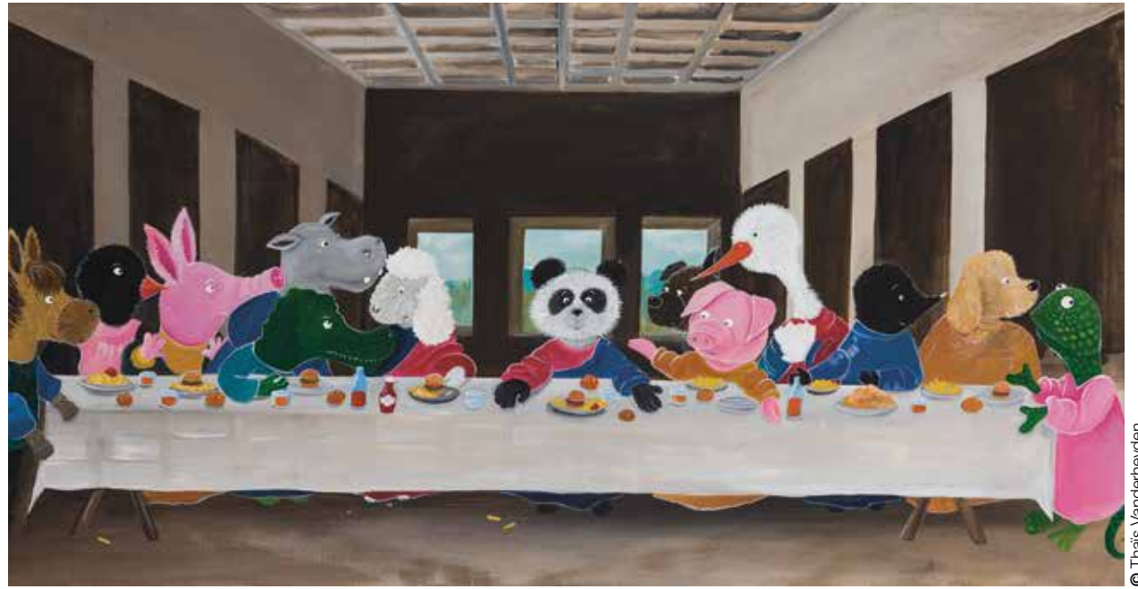
Da Vinci, Laatste avondmaal