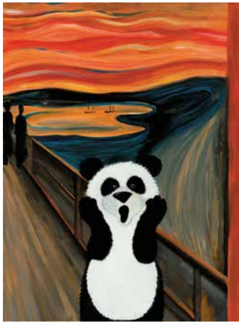
Munch, De schreeuw